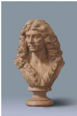
Buste de Molière / [Anonyme]

Buste de Molière / Anonyme (indiqué au dos Caffieri), terre cuite, [s. d.] (achat)