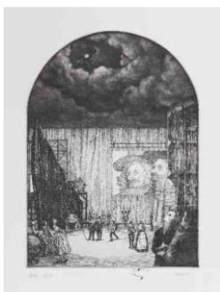
Salade à Richelieu , gravure de Julie Camus, 2017

Epreuve d'artiste pour la gravure Balade à Richelieu , eau-forte avec rehauts de pointe sèche sur papier par Julie Camus, 2018 (don de Julie Camus)