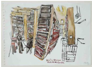
Les archives de la Comédie-Française , dessin de Damien Roudeau, 2015

2 carnets de croquis de propositions et études de Jean-Paul Chambas pour le décor de Dom Juan de Molière, mise en scène de Jean-Pierre Vincent, 2012 (don de Jean-Paul Chambas).