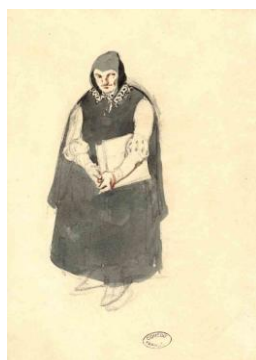
Latréaumont : [Claudius (Samson)], maquette de costume d'Henry Monnier, 1840